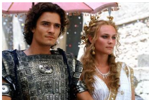
Bilde: Paris og Helena fra filmen «Troy»

Prins Paris av Troja ble forelsket i dronning Helena av Sparta. Hun var ifølge gudinnen Athene den vakreste kvinnen i Hellas. Forelskelsen endte med tilintetgjørelse av Troja, fordi dronningen ble «røvet» av Paris, og krevde av grekernes ære tilintetgjørelse av Troja. Dette er en historie om makt, ledelse, strategi og den menneskelige psykologi.